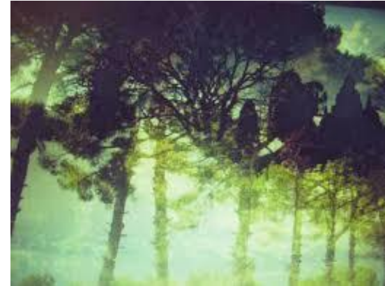
Illustrasjon: Åshild Aurlie