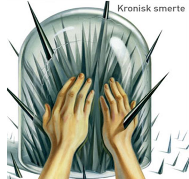
Forside, Tidsskrift for Den norske legeforening 22/ 2012

«Må bare fortsette å spise smertestillende og vente. Bare vente til du kommer opp i himmelen»